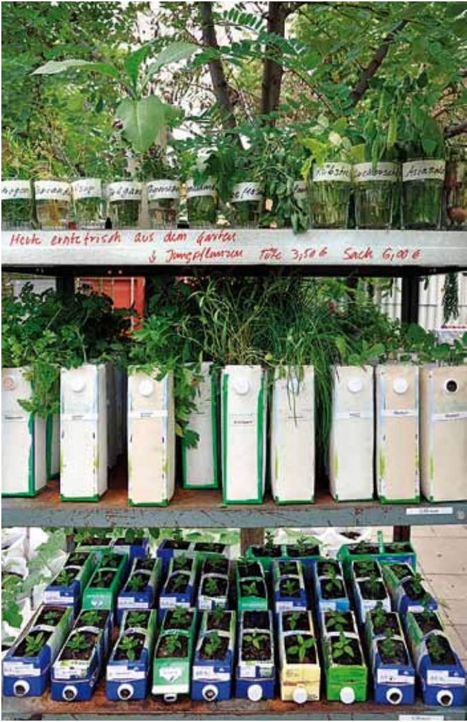
Der Prinzessinnengarten in Berlin: Seit der Eröffnung 2009 zieht es Hunderte von Hobbygärtnern regelmäßig in die grüne Oase am Moritzplatz. Den Pachtzins für das fußballfeldgroße Grundstück erwirtschaften sie durch die Mittagsküche im umgebauten Schiffscontainer und den Verkauf von Jungpflanzen.

»AUF BRACHEN UND UNGENUTZTEN URBANEN NISCHEN WIRD INMITTEN DES GROSSSTADTTRUBELS GEMEINSAM GEPFLÜGT, GEHARKT, GEGOSSEN UND GEPFLEGT.«